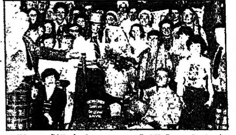
حلم يتحقق في صورة تذكارية... عرس مزييف في (بالكلمة الإنجليزية) حلم يتحقق في صورة تذكارية...

اتمام زواجهم، تكاثرت السرعة واجبة، ومنذ ذلك الحين اطلق على هذا المكان اسم «أولد بلاك سيث»، أي مكان الحداد القبيحة. استقر هذا المكان «خلال المشاكل» ويحيط الإبنه الصغار الهاربين، وازدادت شهيته وشهرته مع الأيام حتى بلغت العالم كله، ولكن في عام 1867 أصدر اللورد بروفام قراراً في اسكتلندا حظر فيه اتمام مراسم الزواج قبل بقاء العروسين في الأراضي الاسكتلندية مدة لا تقل عن 21 يوماً، مما شكل عائقاً أمام الكثيرين الذين يرغبون في السرعة، فاختفت نسبة الناس قبل تدويرها حتى توقفت نهائياً عام 1877. والزائر لـ «غريتا غرين» سيتبع إضافة إلى شراء الأشياء التذكارية وقراءة عقود حفل زواج تقليدي مزييف، يرتدي الهاربين والخاطبتين، عندما اختطف هو نفسه، لكن سرعان ما تبين أن القصة